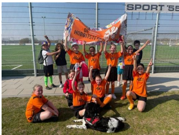
Winnaar schoolvoetbal meiden uit groep 6

Wij, de meiden uit groep zes van de Hobbitstee zijn door naar de finale van het schoolvoetbal. We hebben met 5-0 gewonnen van de Wilhelmina school, daarna hebben we met 0-3 verloren van het Mozaïek en toen weer gewonnen van de Juliana met 8-0!